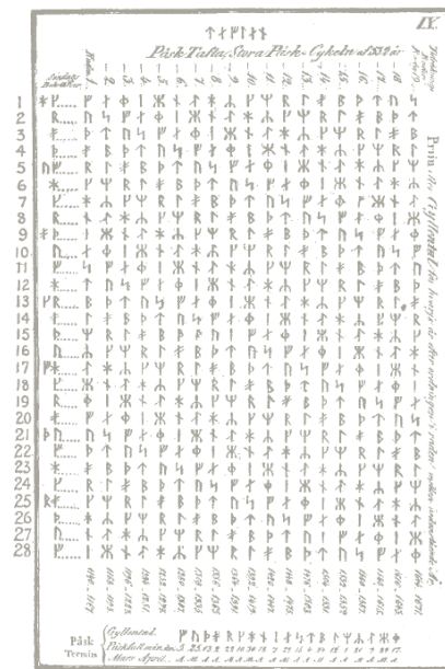
Tábua medieval da Escandinávia, em escrita rúnica, para cálculo da data da Páscoa 23

Logo o Domingo de Páscoa, no ano de 2012, calha a 8 de abril, o Carnaval a 21 de fevereiro e "Corpus Christi" a 7 de junho.