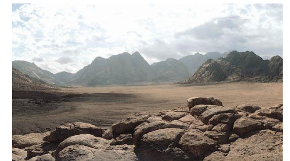
Monte Sinai (Horebe) e o Deserto do Sinai 11

No deserto viveu em oração e recolhimento e teve uma profunda experiência de encontro com o Pai, no entanto, as tentações que Jesus viveu são apresentadas como aquelas que também os cristãos precisam de viver na penitência de quarenta dias. Uma outra ocorrência significativa, na vida e obra de Jesus, é mencionada pelos Atos dos Apóstolos: Jesus, após a ressurreição, permaneceu na terra quarenta dias (At 1.3) 10 .