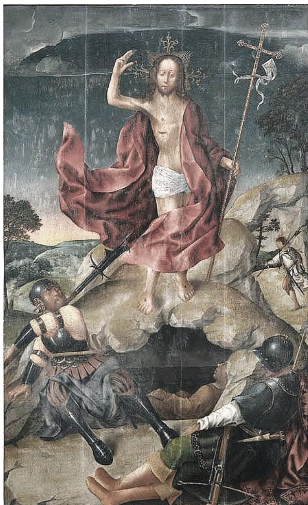
Ressurreição, painel do retábulo da capela-mor da Sé de Viseu. Escola Flamenga, inícios do séc. XVI